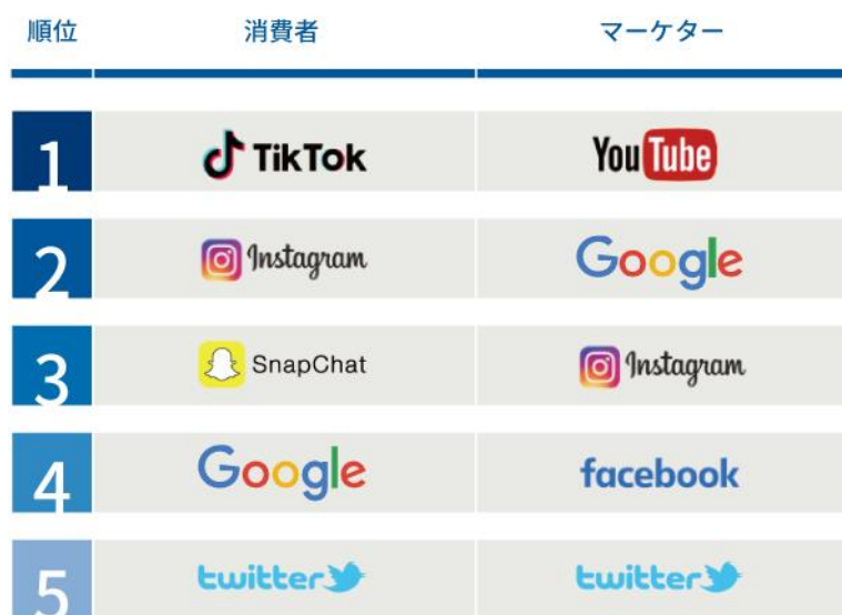
図2: 2020年世界の消費者・マーケターが好むデジタル広告プラットフォーム各上位5

デジタル環境の中では、消費者もマーケターも、Google、Instagram や Twitter などが信頼できるデジタルプラットフォームであることに同意しています。しかし、消費者は一般的に TikTok のような新しいプラットフォームでの広告に肯定的であるのに対し、マーケターは YouTube のようなより確立されたブランドを好んでいます。